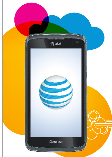
PANTECH FLEX™ P8010